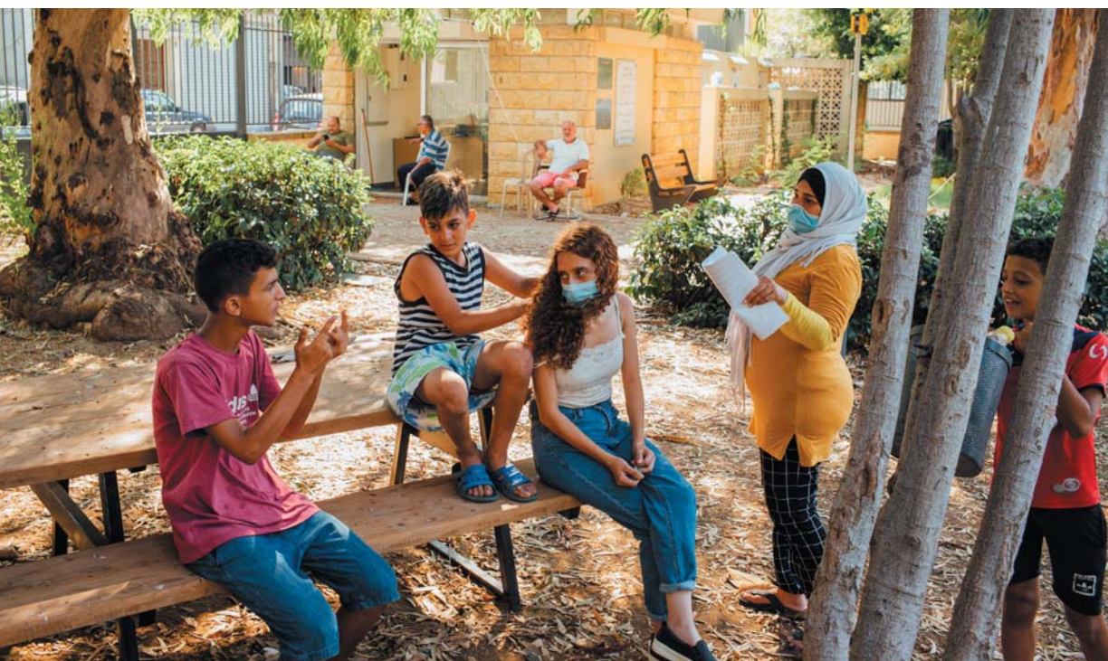
Les familles profitent du parc de la Quarantaine réhabilité par Catalytic Action.

Une étude est ainsi en cours avec plusieurs associations françaises et libanaises pour valoriser les bonnes pratiques et apprendre des écueils de la réponse à l'urgence pour s'améliorer lors des prochaines crises.