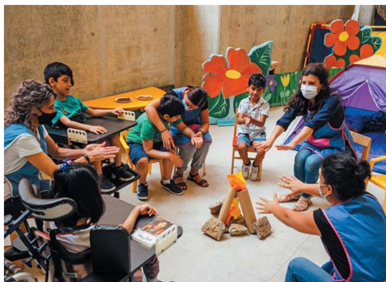
Activités éducatives adaptées pour les enfants handicapés reçus dans le centre de Sesobel à Antoura.

Les organisations Première Urgence Internationale, Centre Libanais des Droits de l'Homme, Skoun, Queer Relief Fund, Libami Cholet, Partage/Le Mouvement social apportent des aides financières, matérielles et un accompagnement socio-psychologique régulier aux personnes et familles les plus vulnérables.