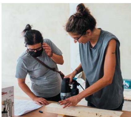
Visite du nouvel atelier de formation de Warchée en cours d'installation et d'équipement par les femmes en juillet 2021

L'association Warchée est une jeune ONG libanaise créée afin de renforcer la présence des femmes dans le domaine de la construction. Le projet propose des cours de menuiserie et d'ébénisterie pour des femmes beyrouthines. Avec un double objectif : répondre à la demande croissante de mobilier local suite à l'explosion et au besoin de créer des activités génératrices de revenus en ces temps de crise. Des sessions semestrielles, encadrées par des professionnels, sont organisées pour près de 20 femmes à chaque fois, dans des ateliers spécialisés. Au total, ce seront 150 femmes issues des quartiers de Beyrouth les plus affectés par l'explosion qui sont formées en 3 ans, à raison de 50 femmes par an. Ces formations permettront dans un premier temps de réhabiliter et/ou équiper 40 maisons endommagées par l'explosion.