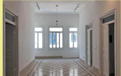
En haut, avant restauration, en bas, après les travaux.